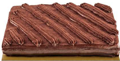
Immagine a scopo illustrativo