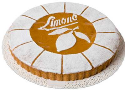
Immagine a scopo illustrativo