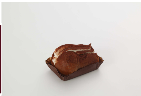
Immagine a scopo illustrativo